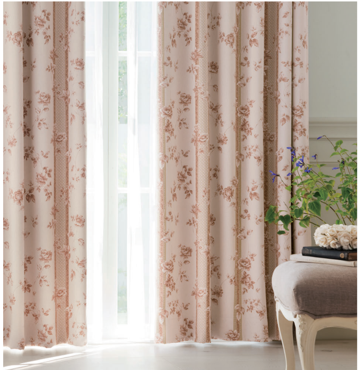
LS-63375 / レース ウェイトテープ巻きロック加工 LS-63467