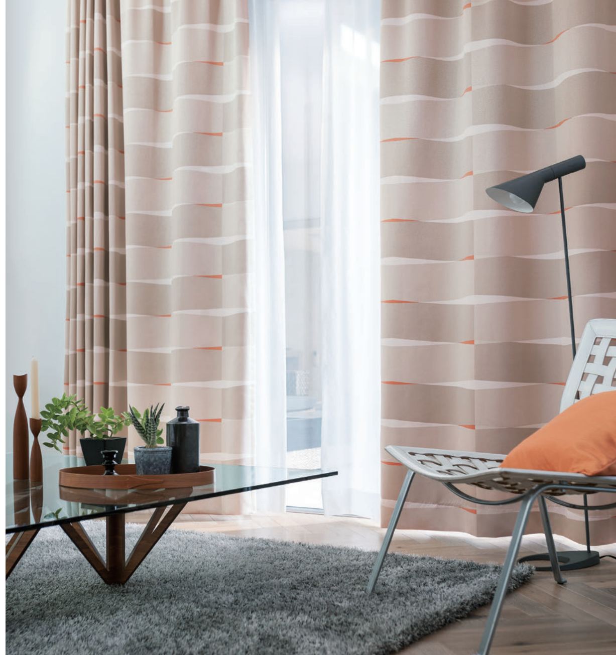
LS-63360 / レース LS-63469