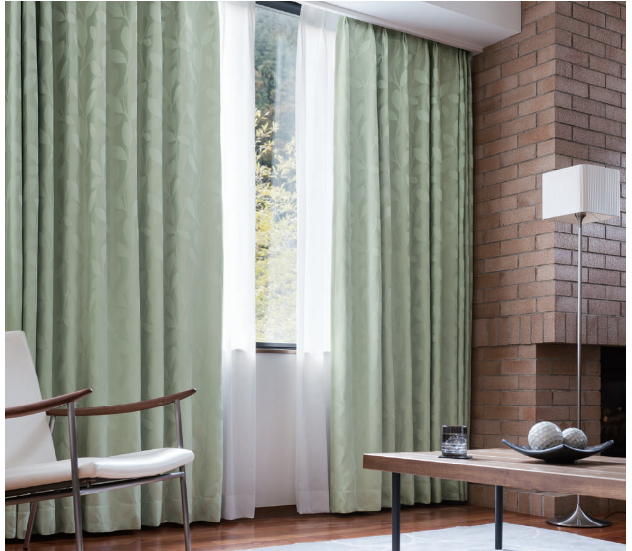
LS-63348 / レース LS-63499