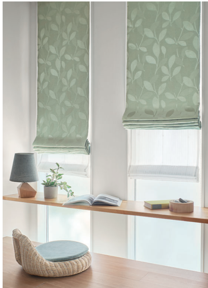
ダブルシェード (ブレン+ブレン) 65-63348+63512