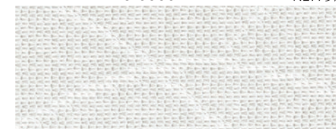
ウォッシュابل / 遮熱 / 花粉キャッチ / ミラー