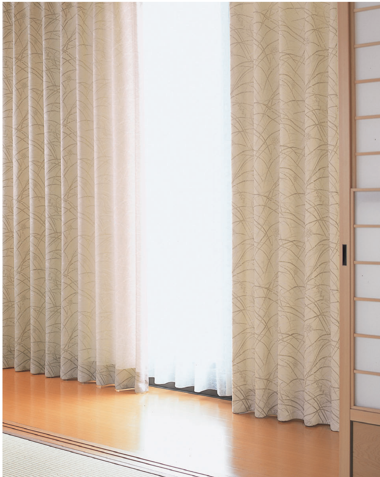
LS-63313 / レース LS-63532