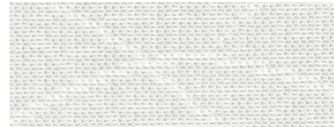
ウォッシュアブル / 遮熱 / 花粉キャッチ / ミラー