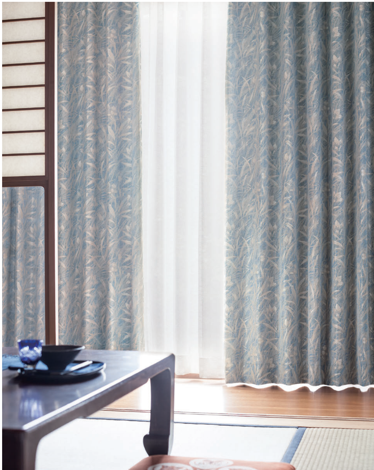
LS-63312 / レース LS-63532