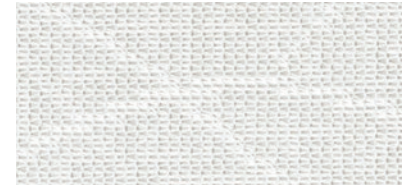
ウォッシュブル / 遮熱 / 花粉キャッチ / ミラー