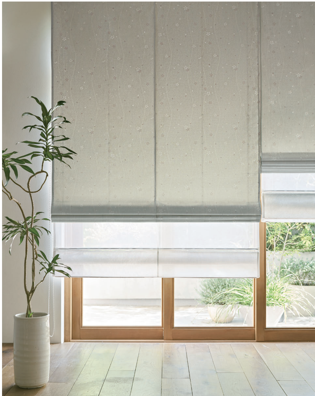
ダブルシェード (ブレン+シャープ) 67-63307+63469