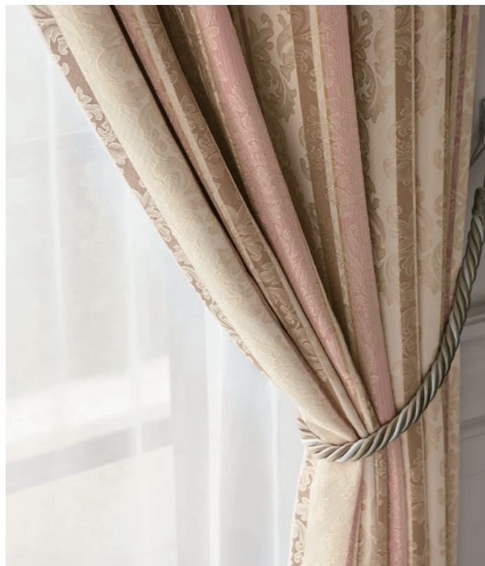
LS-63304 / レース LS-63470 / タッセル 63664T