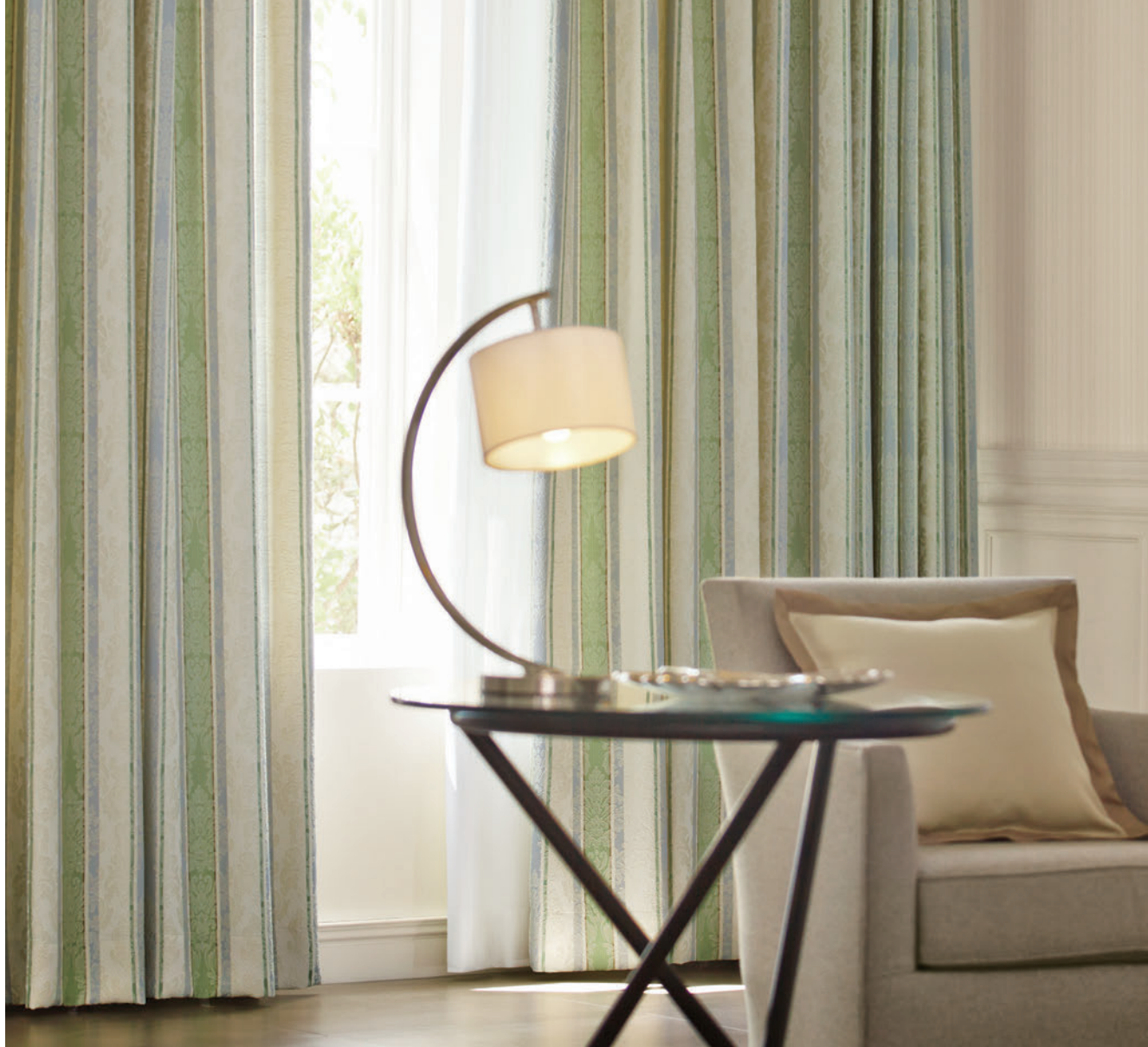
LS-63305 / レース LS-63470