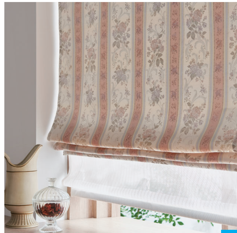
ダブルシェード (ブレースェード+ブレースェード) 65-63301+63522

※ドラム式=仕上り巾39cm以下の場合、仕上り丈は200cmまで。 税抜/円 ※コード式価格=ドラム式価格-3,000円 ※上記以外の寸法は別冊「お仕上り価格表」をご覧ください。