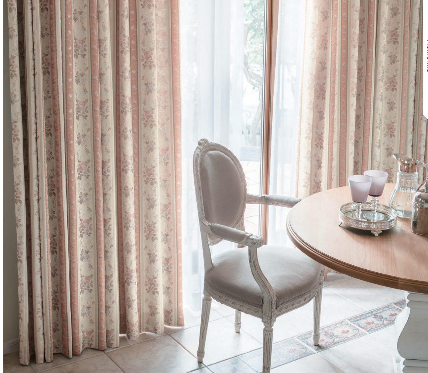
LS-63301 / レース LS-63507