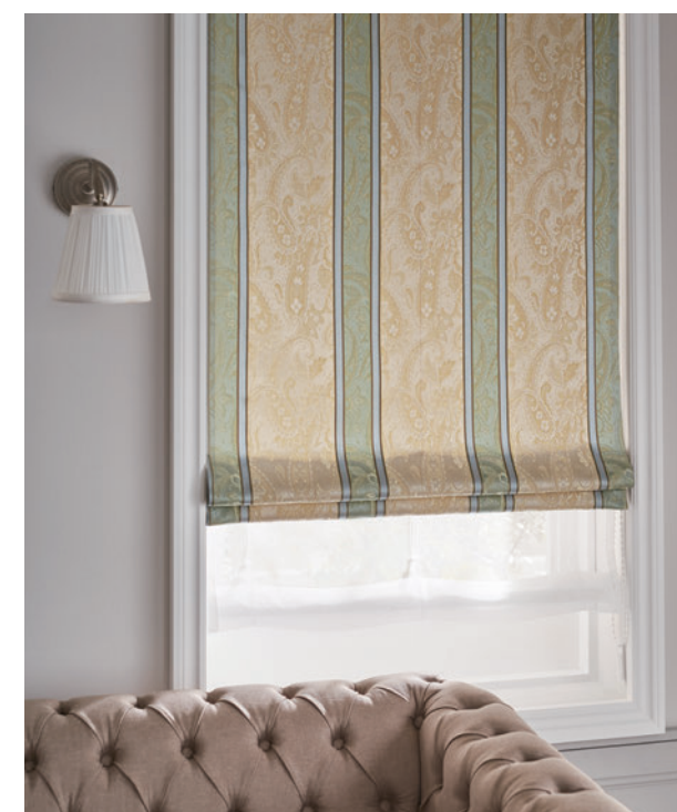
ダブルシェード (ブレース+ブレース) 65-63298+63479