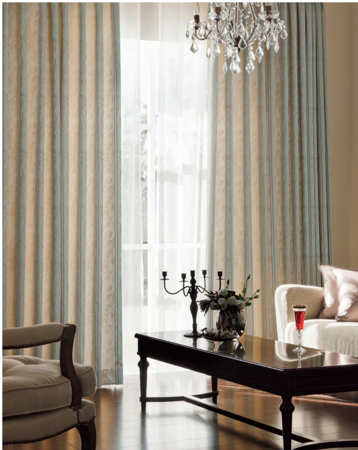
LS-63298 / レース LS-63479