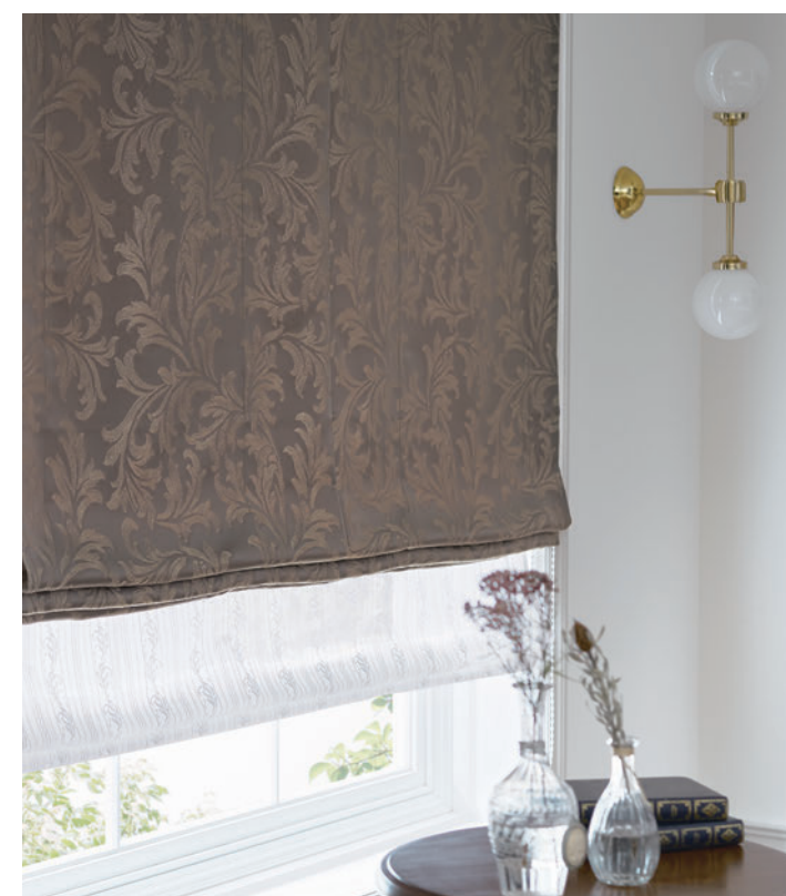
ダブルシェード (プレーン+プレーン) 65-63291+63500