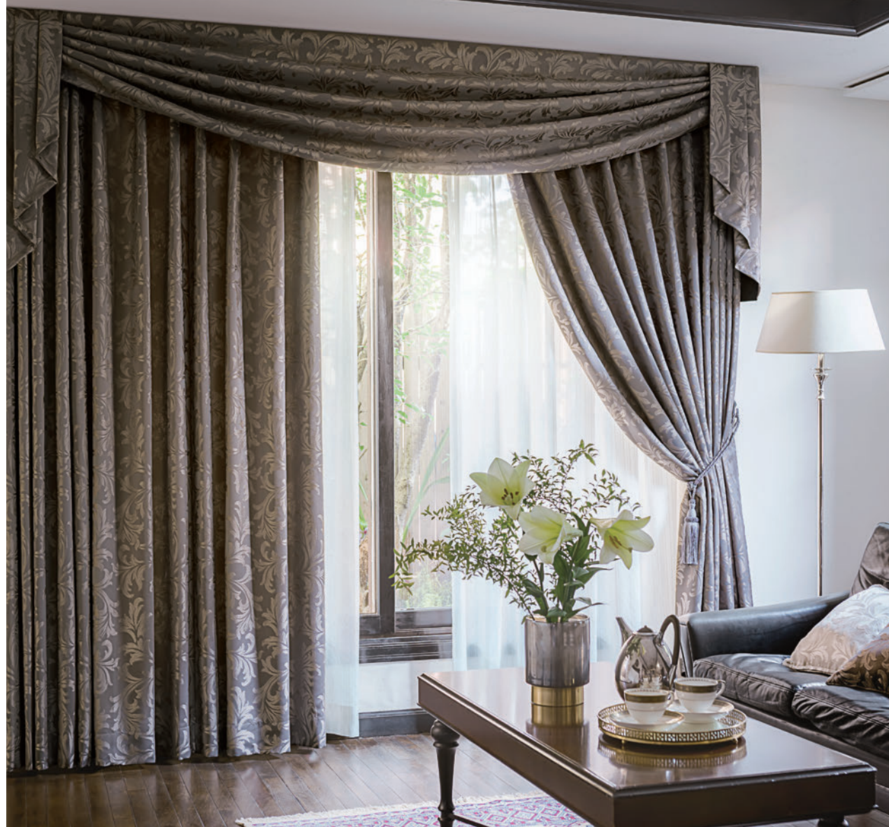
LS-63291 / クラシックバランス5 LS-63291 / レース LS-63493 / タッセル 63648T