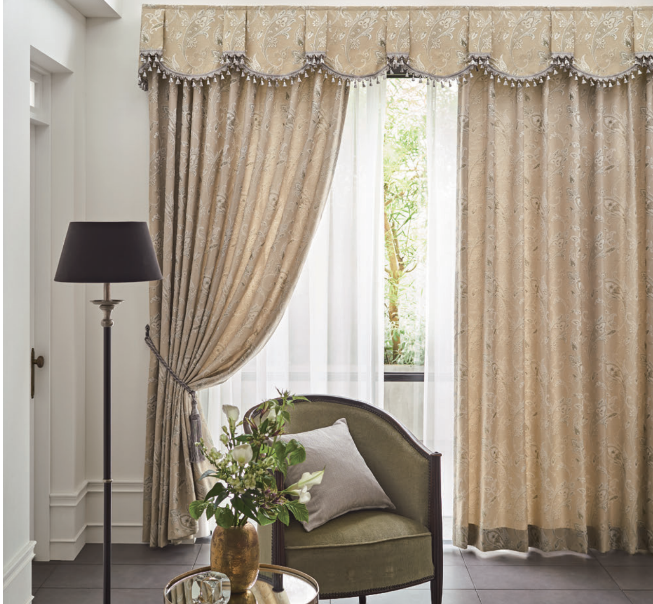
LS-63289 / キングストーンバランス+フレンジ LS-63289+63653F / レース LS-63467 / タッセル 63648T