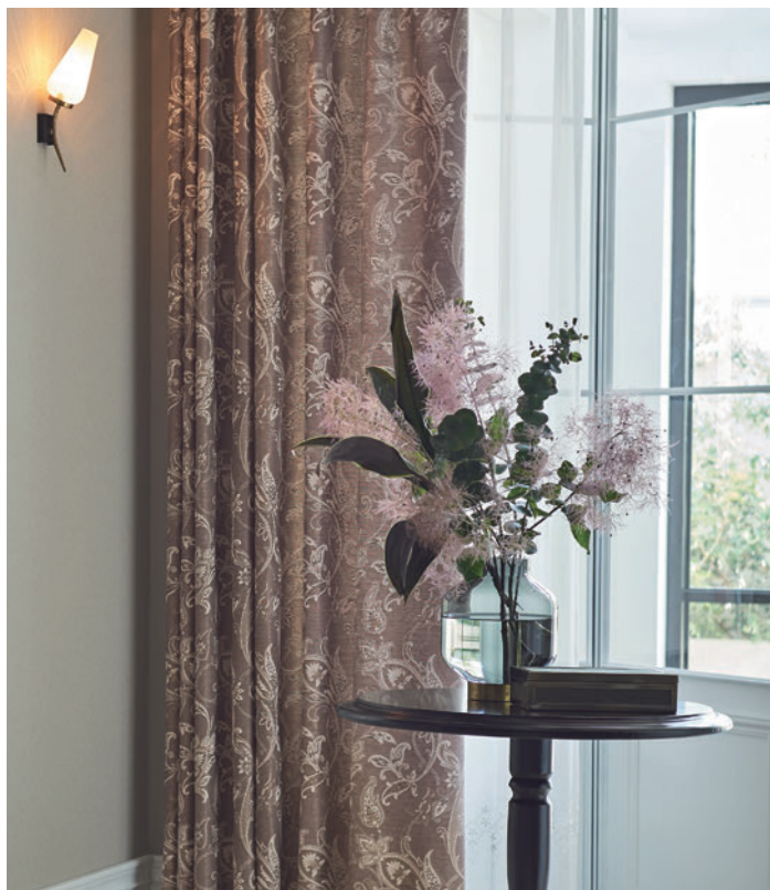
LS-63290 / レース LS-63486