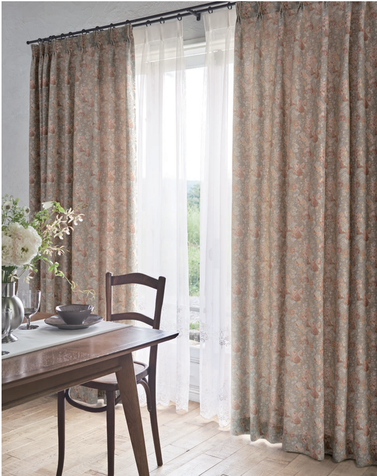
LS-63287 / レース LS-63488