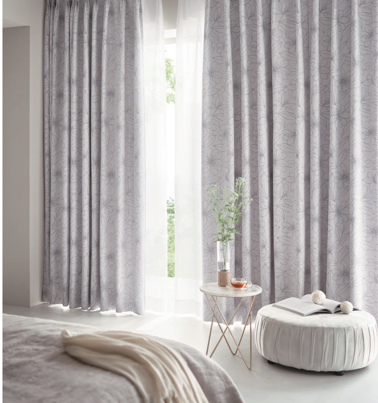
LS-63284 / レース LS-63510

※ドラム式=仕上り巾39cm以下の場合、仕上り丈は200cmまで。 税抜/円 ※コード式価格=ドラム式価格-3,000円 ※上記以外の寸法は別冊「お仕上り価格表」をご覧ください。