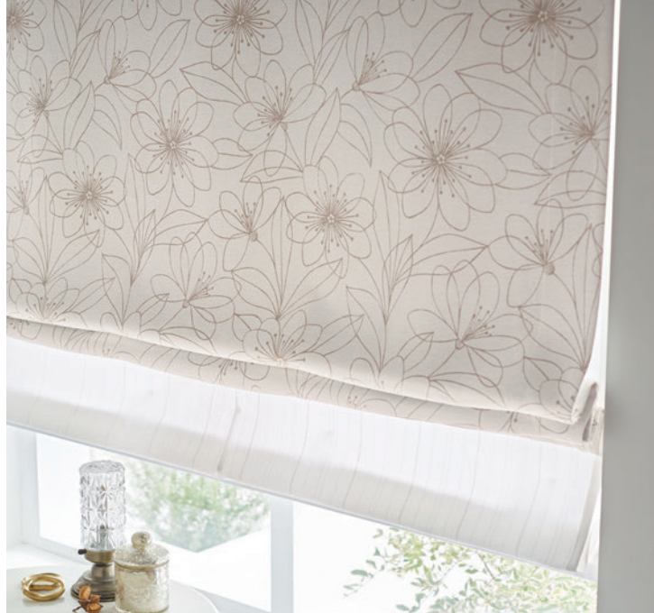
ダブルシェード(プレーン+プレーン) 65-63283+63499