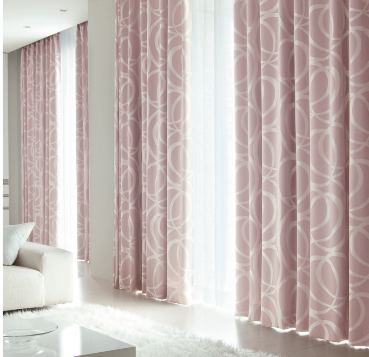
LS-63282 / レース LS-63478