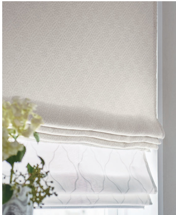
ダブルシェード (ブレン+ブレン) 65-63277+63496