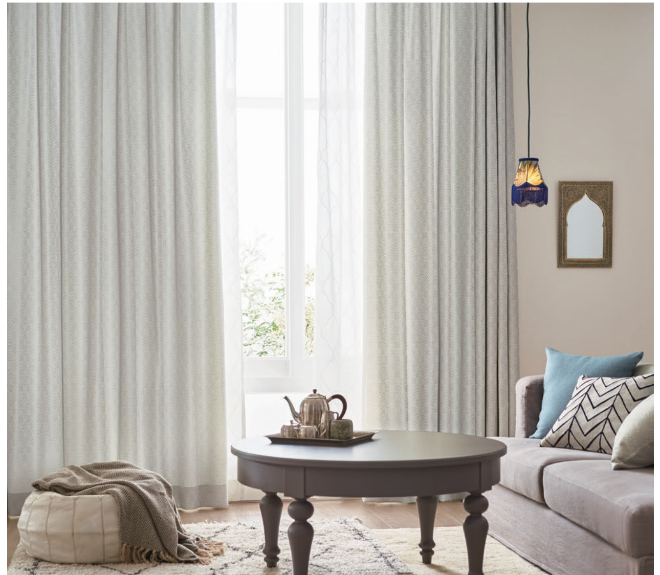
LS-63278 / レース LS-63496