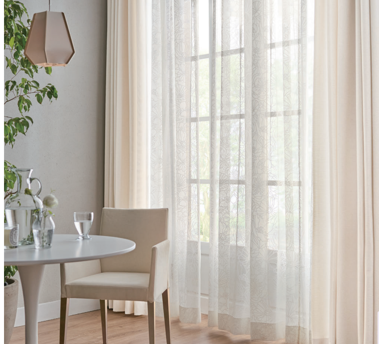
LS-63266 / ドレープ LS-63151