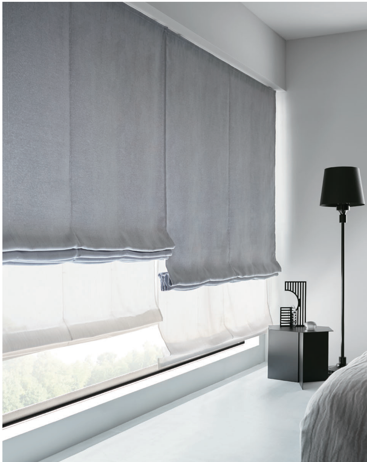
ダブルシェード (プレーン+プレーン) 65-63245+63504