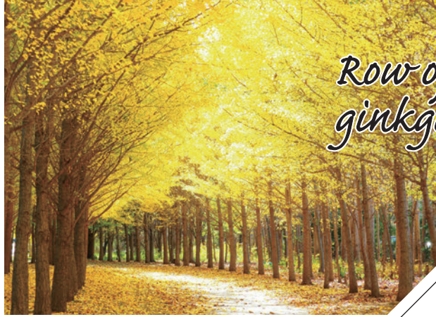
Row of ginkgo trees