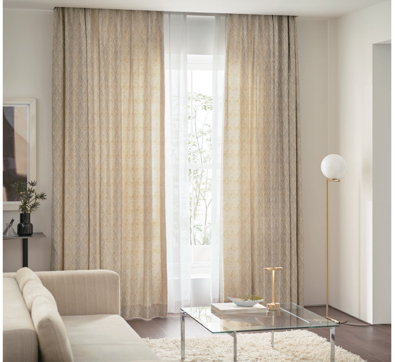
LS-63244 / レース LS-63521