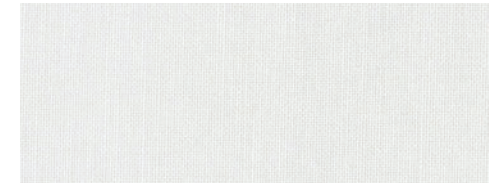
ウォッシュブル / 防カビ