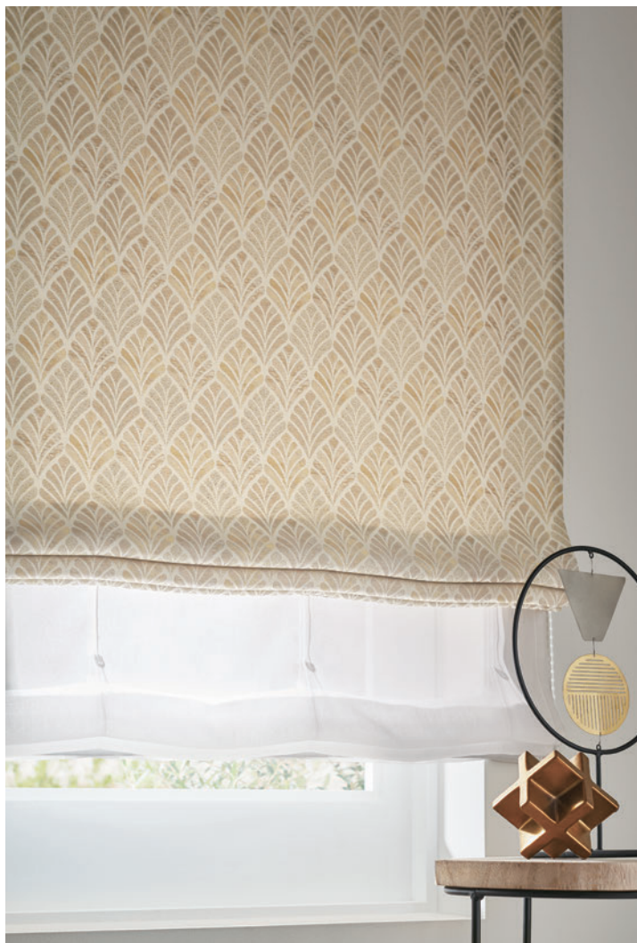
ダブルシェード (ブレン+ブレン) 65-63244+63521