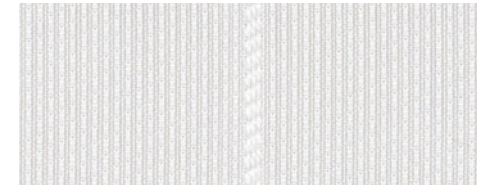
ウォッシュابل / 遮熱 / ミラー