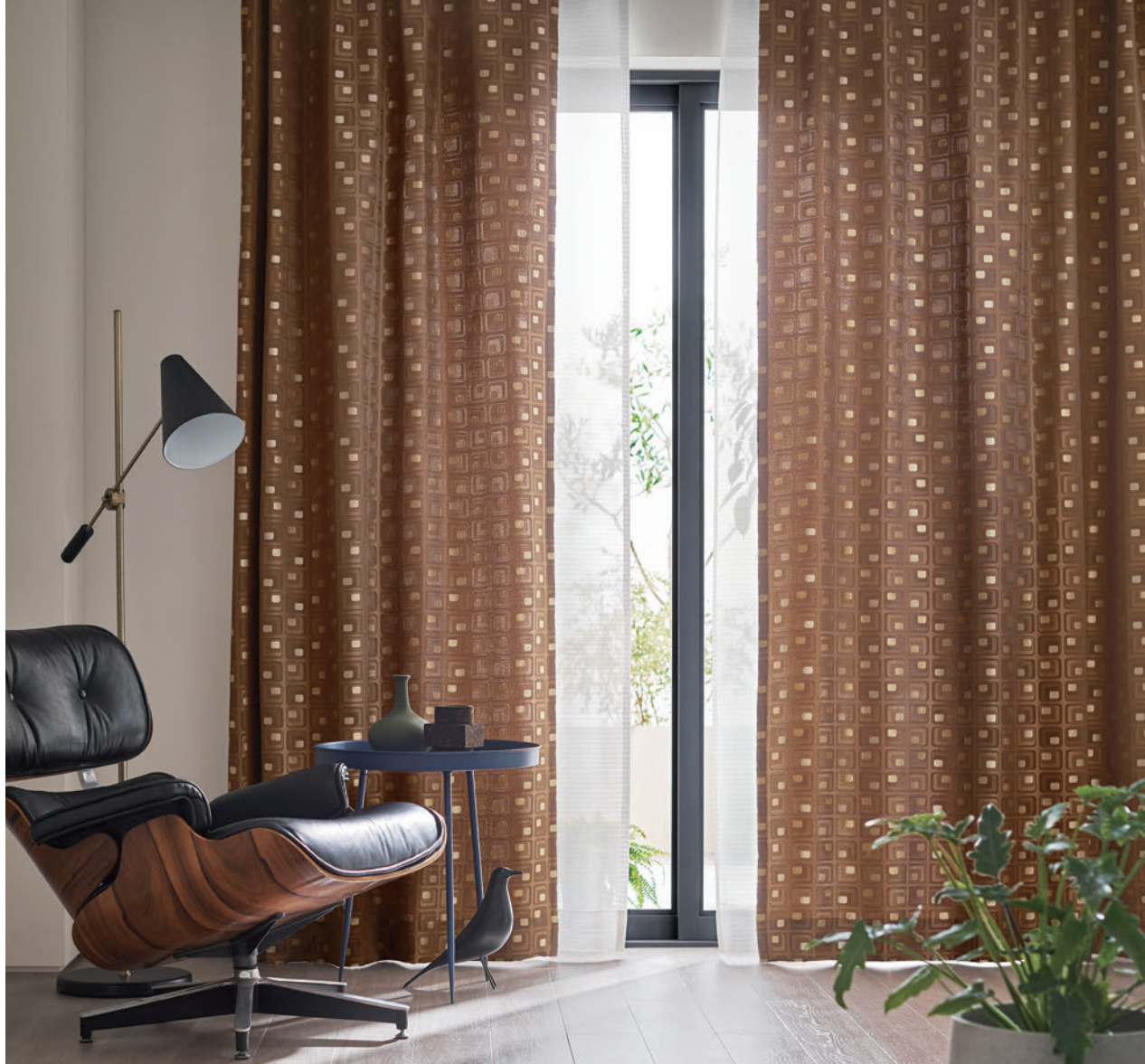
LS-63238 / レース LS-63518