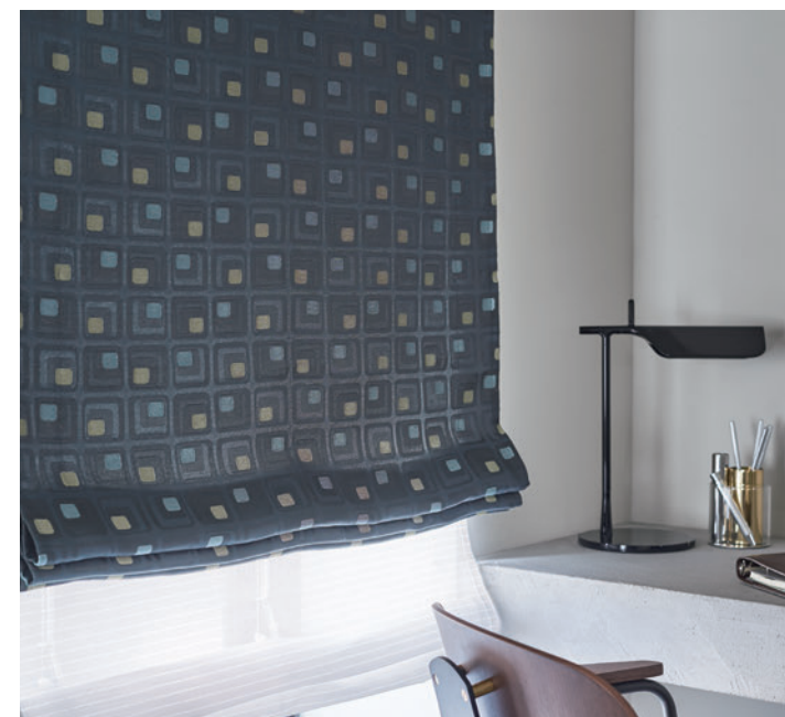
ダブルシェード (ブレース+ブレース) 65-63239+63518