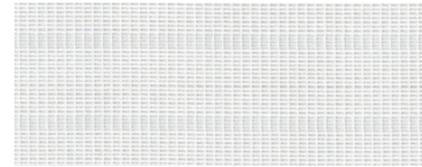
ウォッシュابل / 遮熱 / ミラー