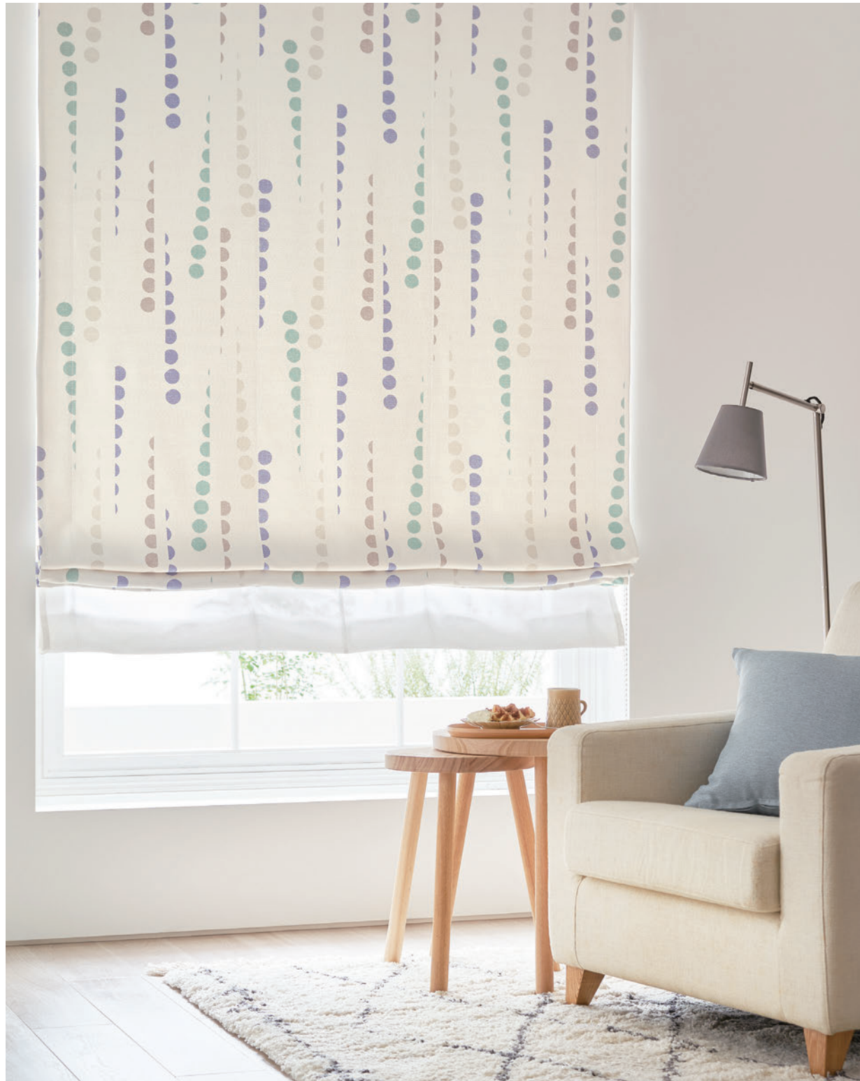
ダブルシェード (プレーン+プレーン) 65-63212+63524