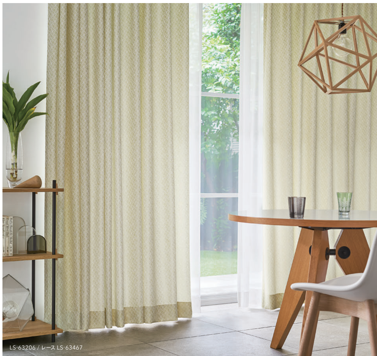
LS-63206 / レース LS-63467