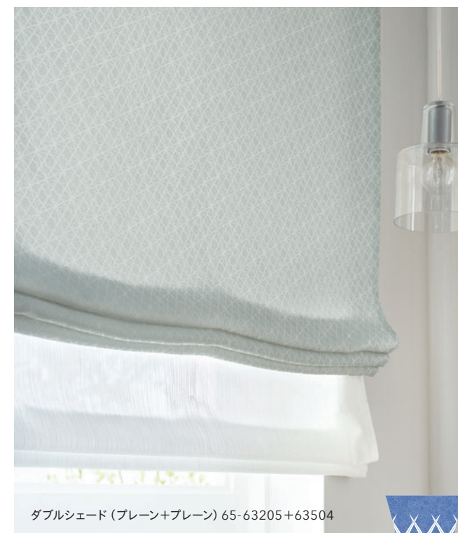
ダブルシェード (プレーン+プレーン) 65-63205+63504