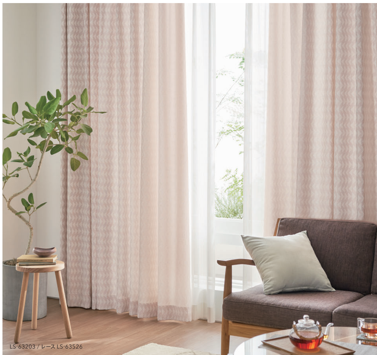
LS-63203 / レース LS-63526