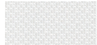
ウォッシュابل / ミラー