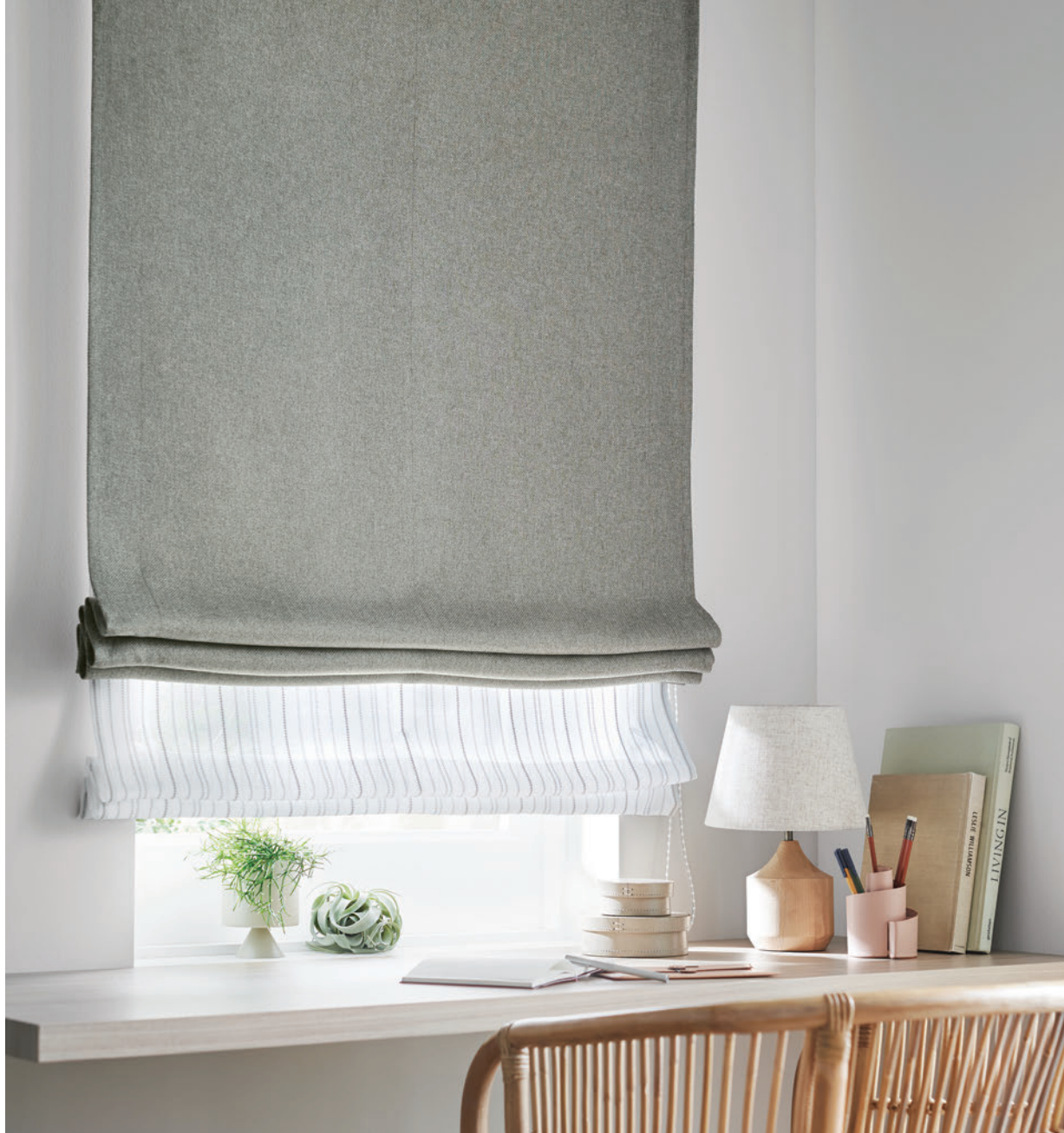
ダブルシェード (プレーン+プレーン) 65-63185+63492