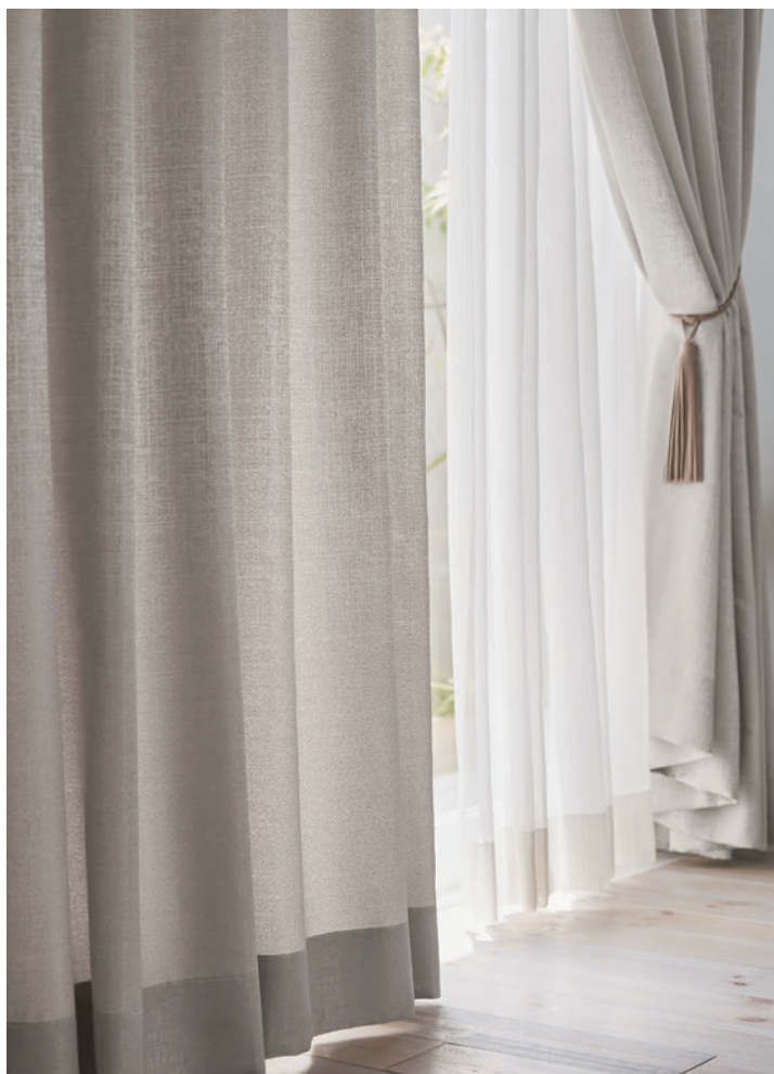
LS-63130 / レース LS-63465 / タッセル 63657T