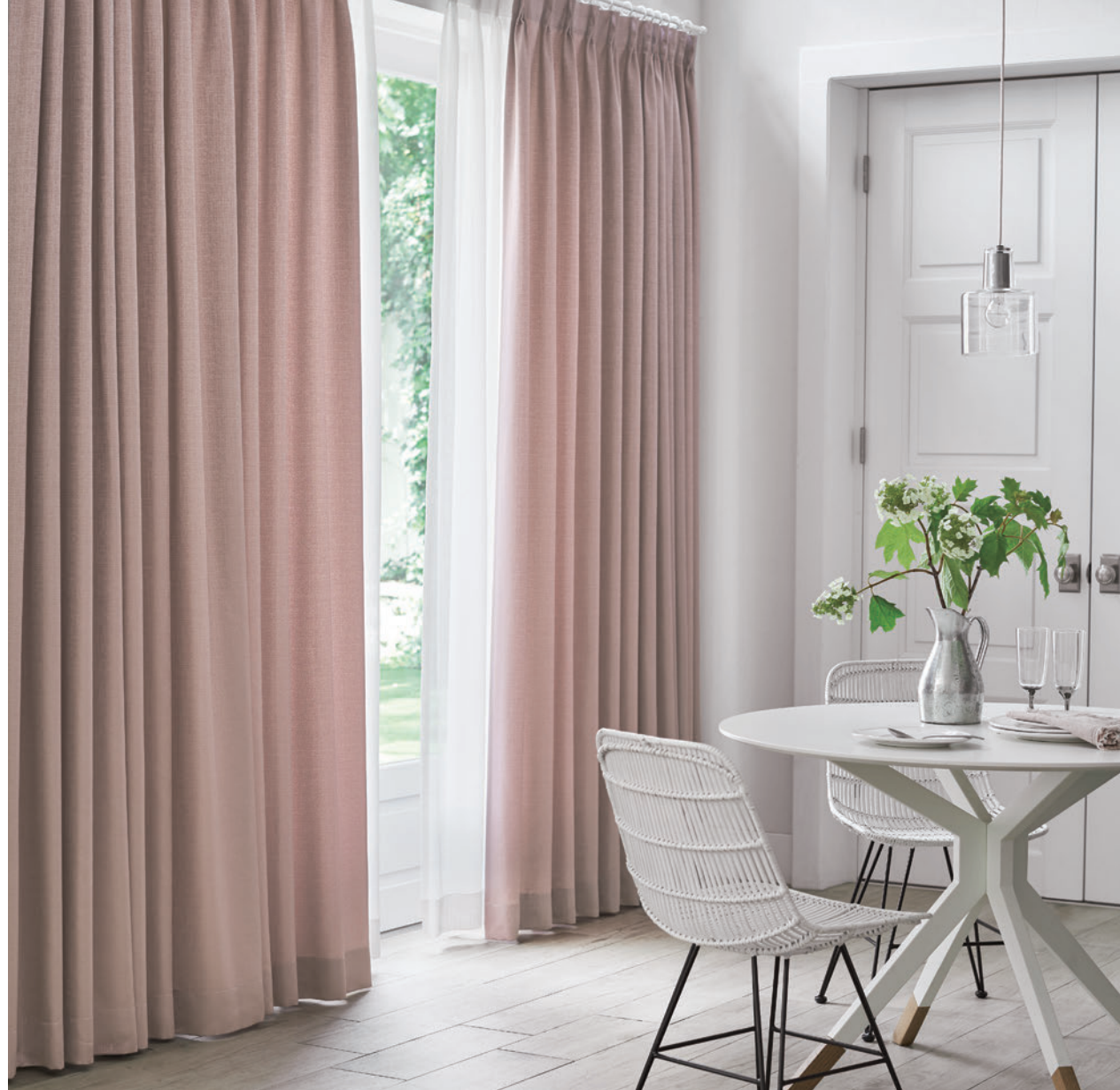
LS-63132 / レース LS-63465