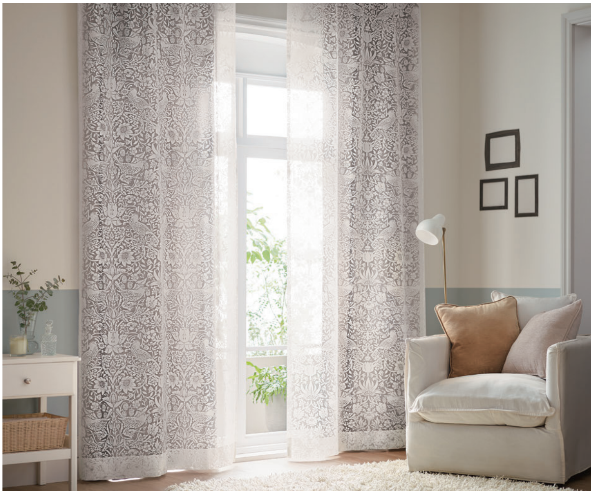
V&A LS-63018 / ドレープ Lilycolor British Colours LS-63022 / 壁紙 LW-94 + LW-113