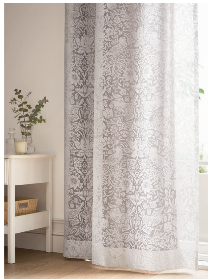
V&A LS-63018 / ドレープ Lilycolor British Colours LS-63022

クラシカルなアーツ・アンド・クラフツのデザインから引用した華麗な鳥とイチゴは白1色のオパールプリントで表現。窓際に美しい装飾を。