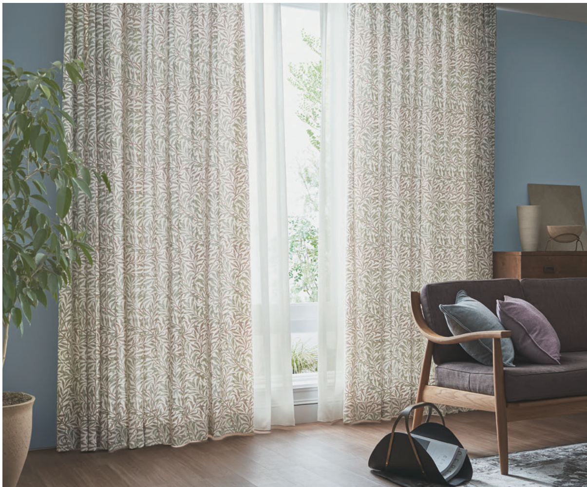
V&A LS-63012 / レースウエイトテープ巻きロック加工 Lilycolor British Colours LS-63053 / 壁紙 LW-109