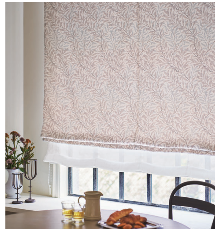
ダブルシェード (ブレン+ブレン) 65- V&A 63013+ Lilycolor British Colours 63050

モリスは多くの図案を植物の観察をして描きました。 ウィロー・バウの場合は、自邸の庭や散策中に見かけた野花や木々からインスピレーションを得ています。ウィローはモリスが最も好んだモチーフのひとつで、いくつかの壁紙やテキスタイルに採用しています。