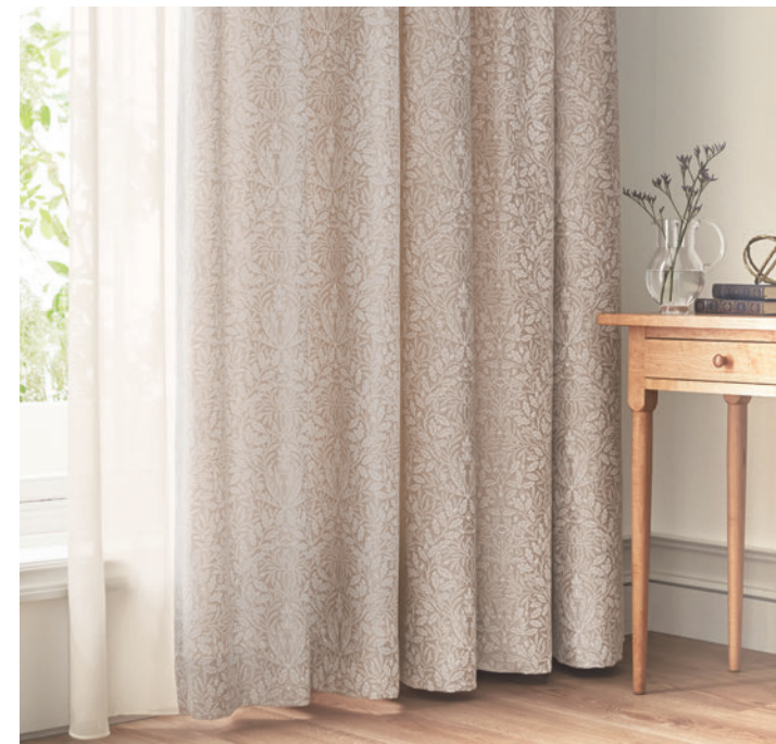
LS-63008 / レース ウェイトテープ巻きロック加工 LS-63051

1879年にウィリアム・モリスが木版プリントの壁紙としてオークの実と葉っぱを確立された構図で描いたデザインです。モリスのデザインは自然主義でとても英国的でありながら、19世紀には新鮮かつ穏やかに先鋭的でもありました。モリスの壁紙の人気の理由は田園、森林、生垣などを細かく観察した上で描かれていたことによります。