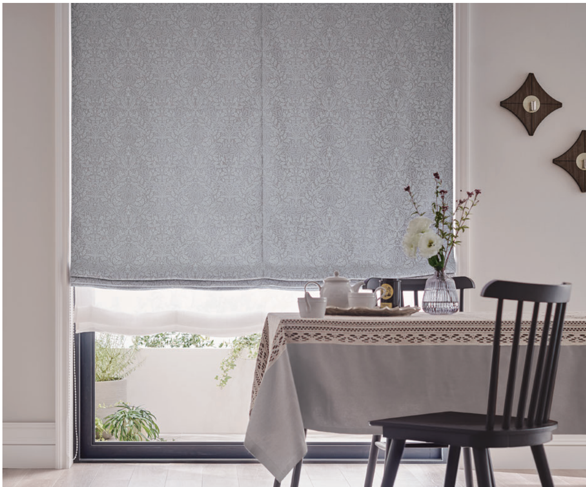
ダブルシェード (ブレース+ブレース) 65- 63009+ 63050