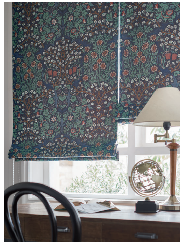
ブレースシェード 60- V&A 63004