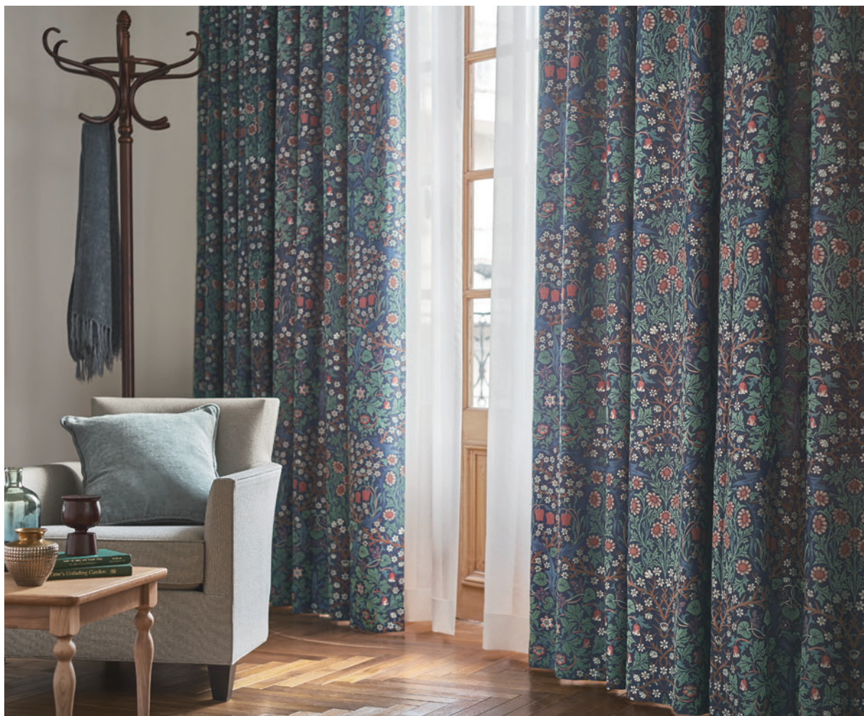
V&A LS-63004 / レース Lilycolor British Colours LS-63052 / 壁紙 LW-95