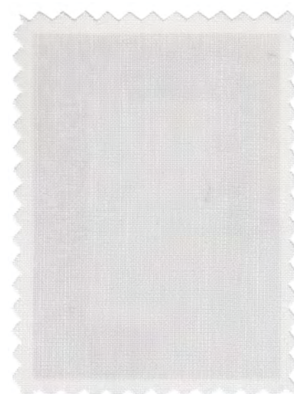
D-4506 クラス2 uVA