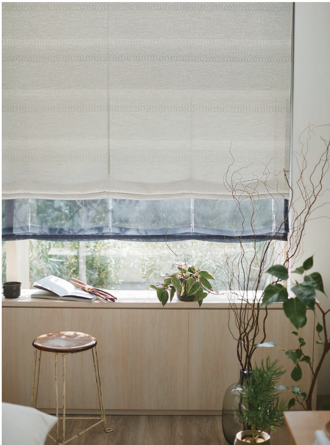
D-4093 プレーンシェード ダブルタイプ:R77H・D-4093 (フロント) + D-4478 (バック)