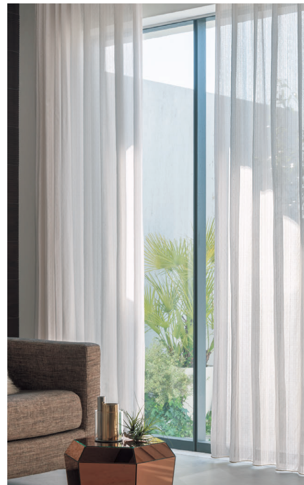
レース(ウェイトテープ仕様)1600