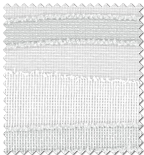
ML-1565 NEW P.8 掲載 見えにくさ UVカット率 40% 60%