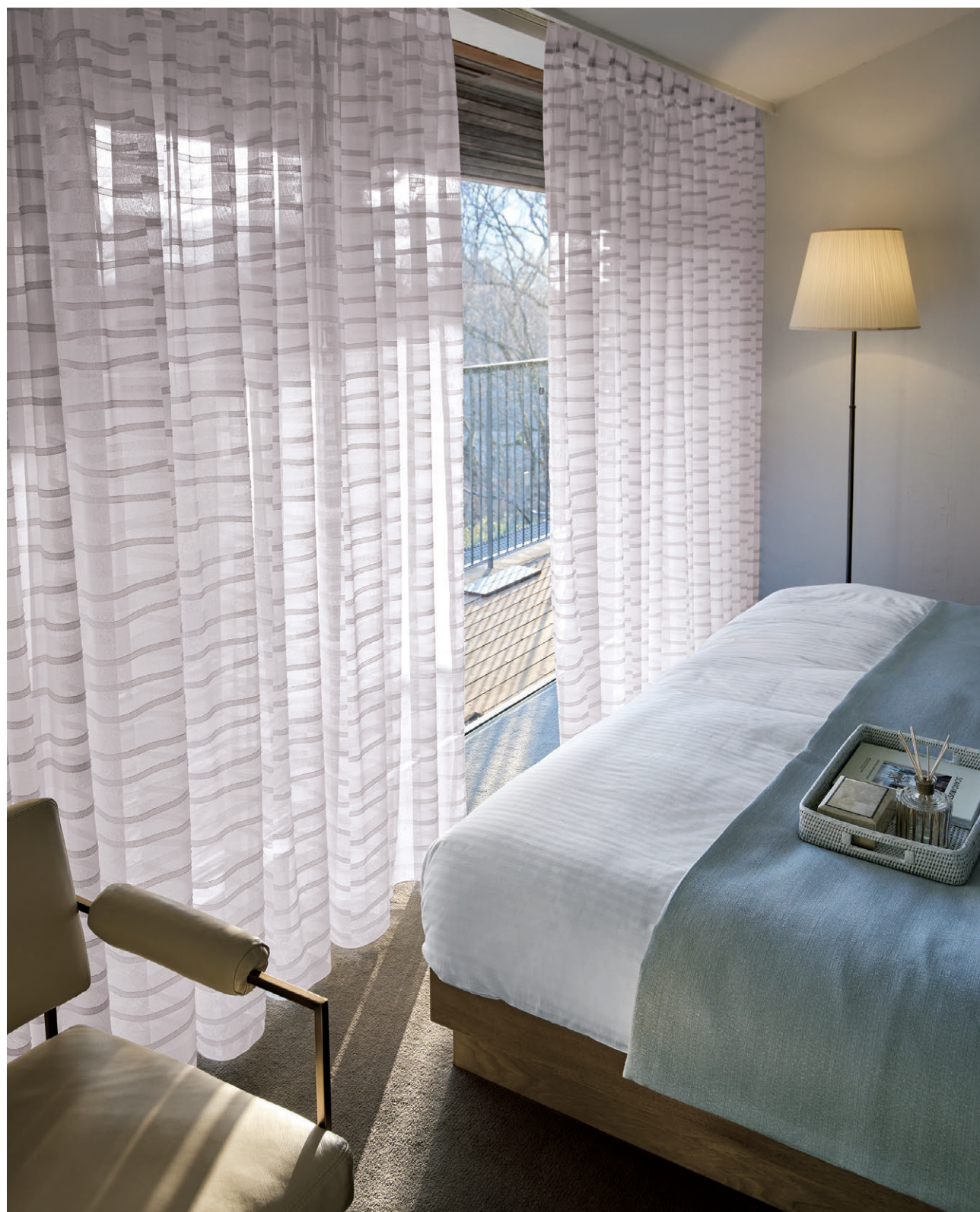
レース(ウェイトテープ仕様) I566 ベッドスローI435