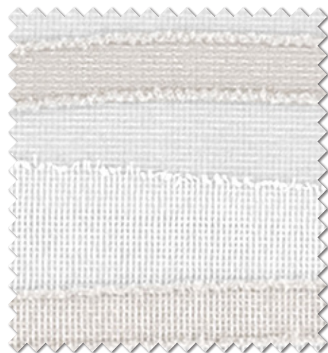
ML-1566 NEW 見えにくさ UVカット率 40% 60%