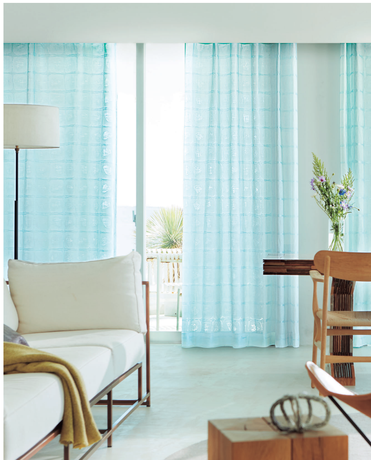
レース(フラットアジャスターカーテン)1563