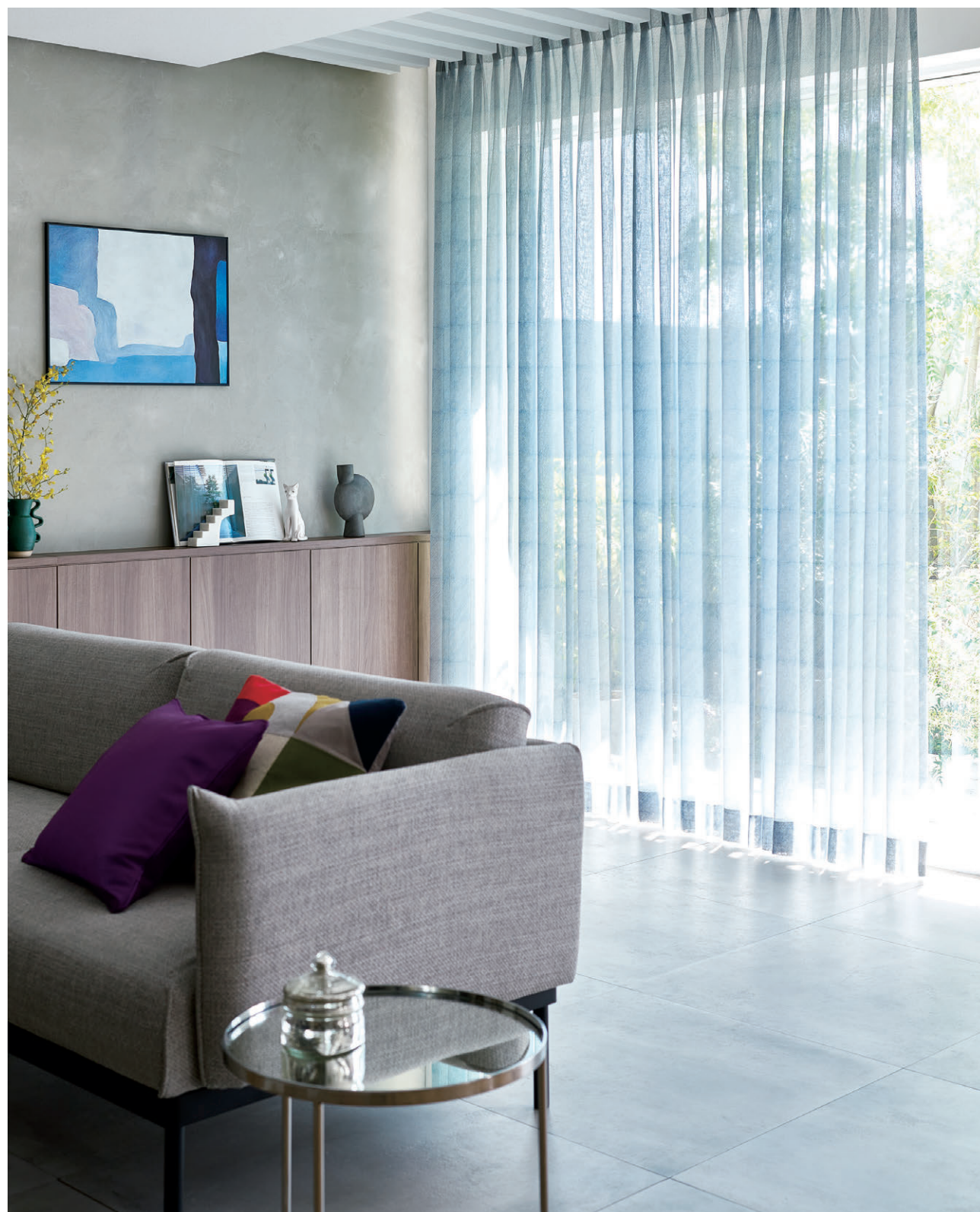
レース1559 クッション1504