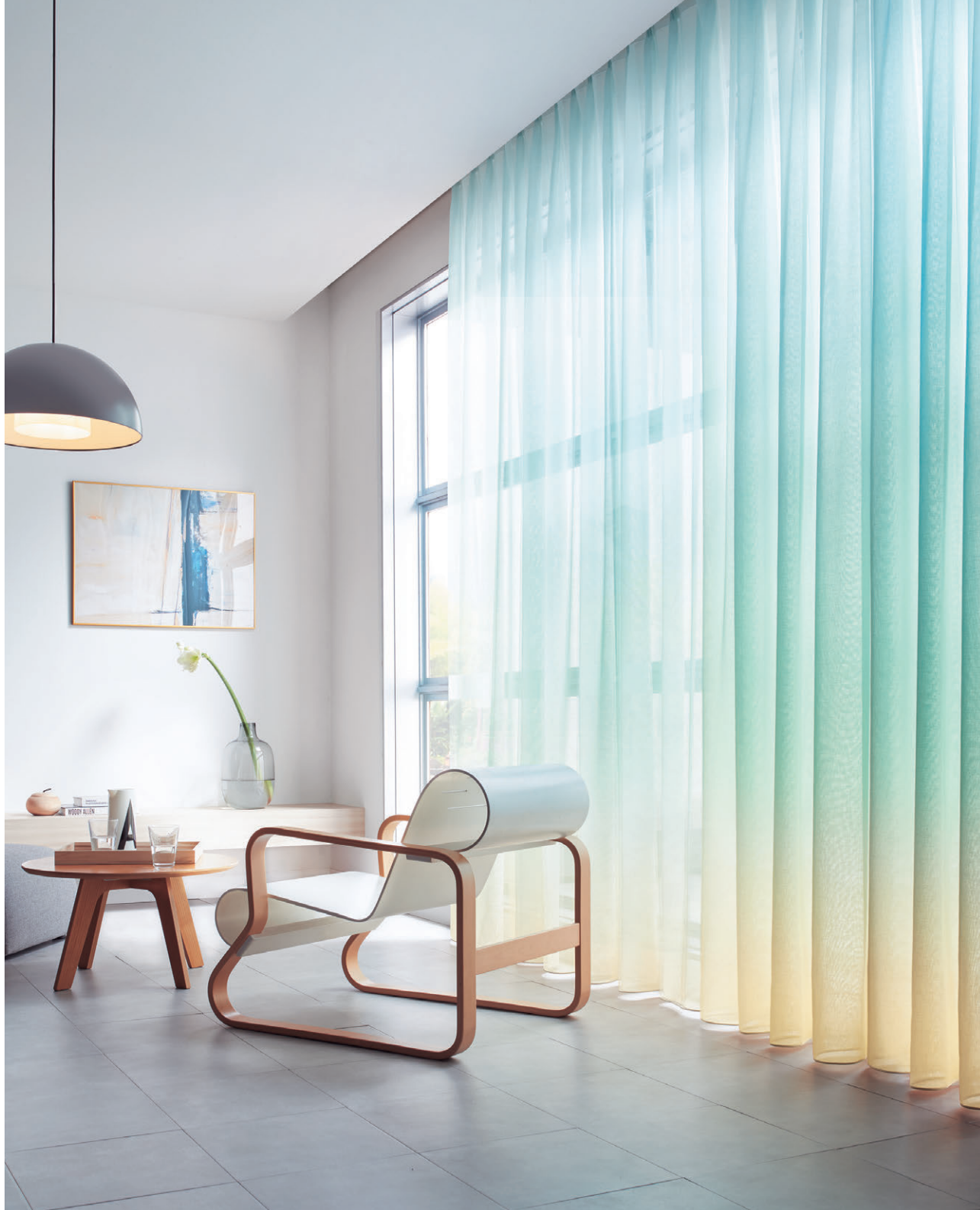
レース(ウェイトテープ仕様) I556 (縫製位置: A-2)