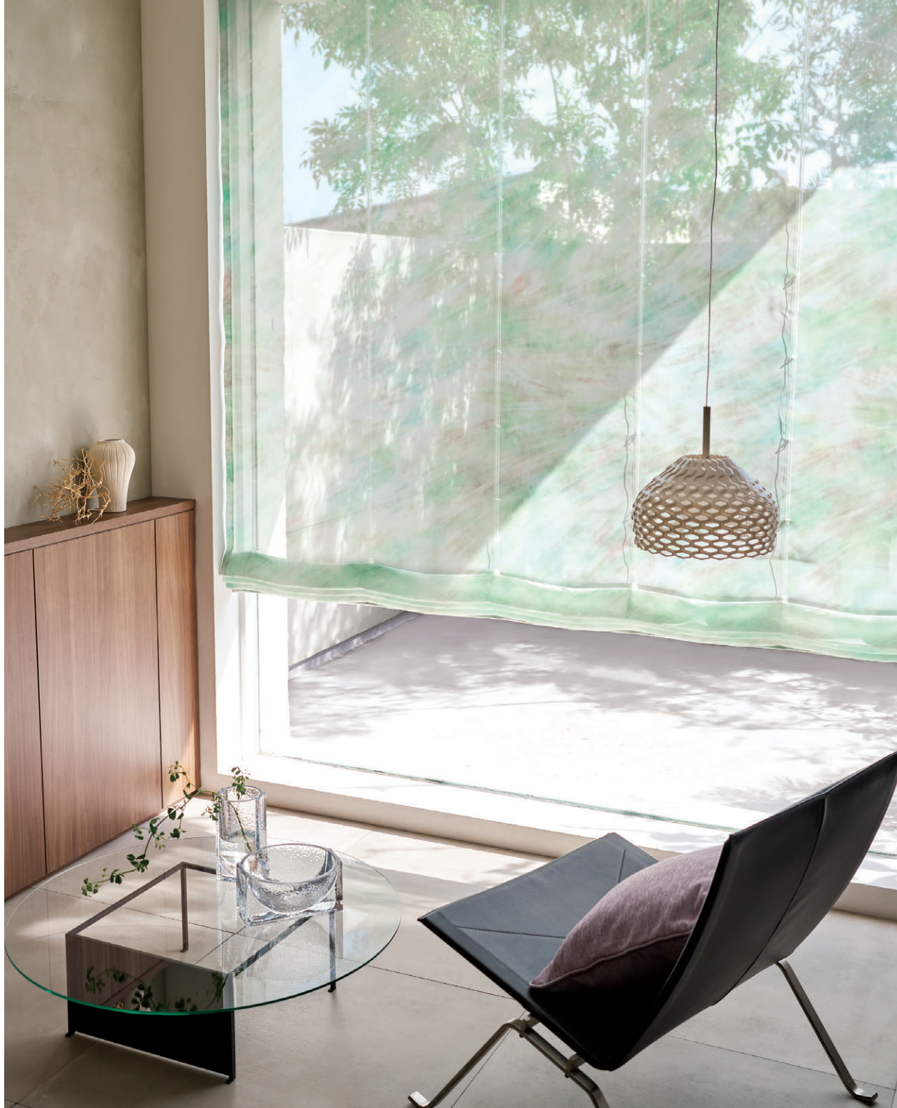
ブレースェード1555 クッション1258