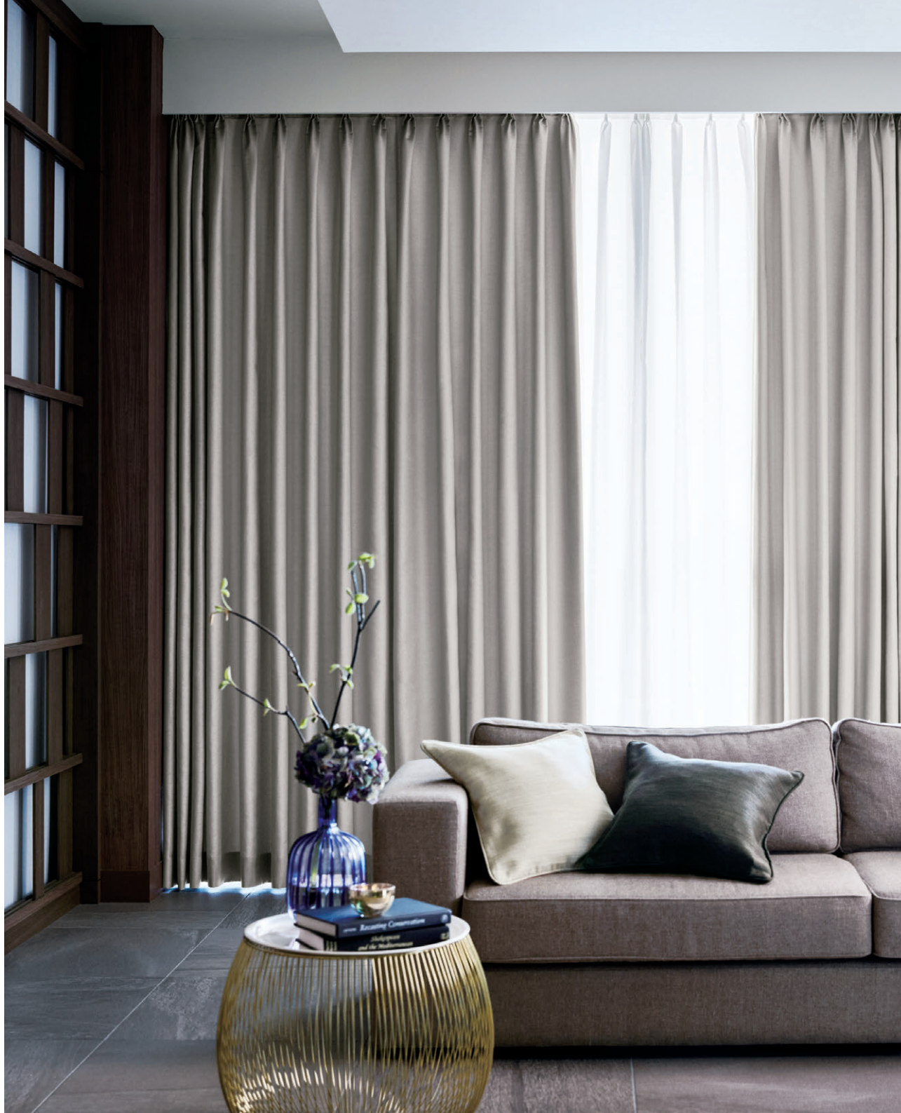
ドレープI466 レースI614 クッション[左から]I264 I283