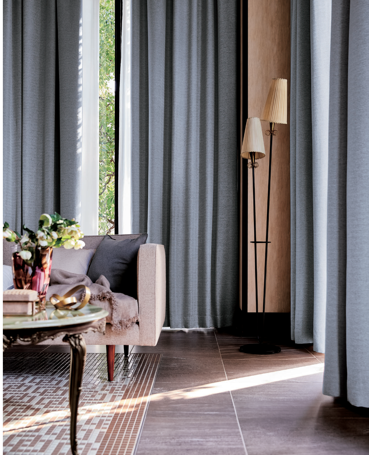
ドレープ1453 レース1614 クッション[左から]1251 1253