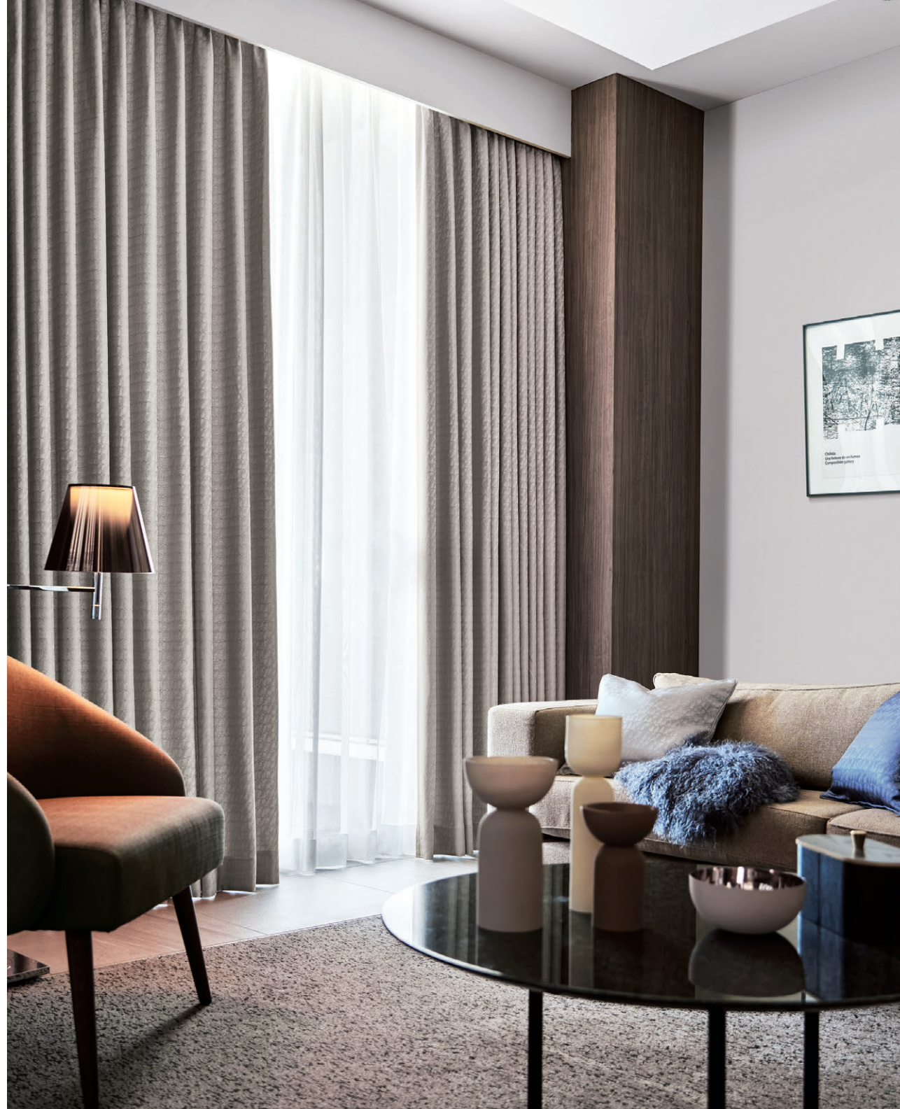
ドレープI422 レースI658 クッション[左から]I422 I423