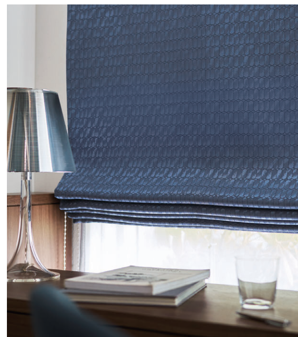
ブレースェード・ダブルシェード仕様 前I423 後I592