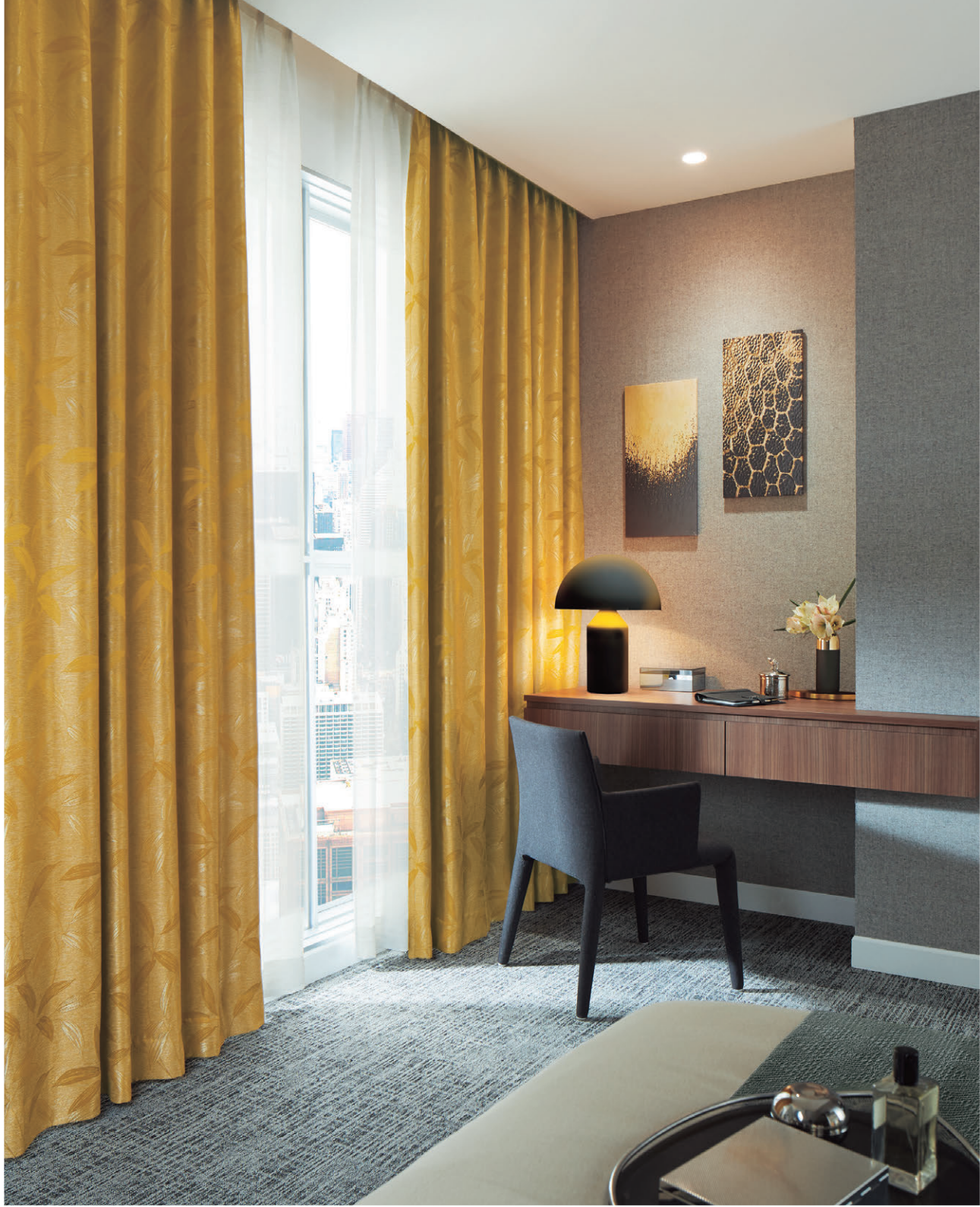
ドレープ1397 レース1617 ベッドスロー1145