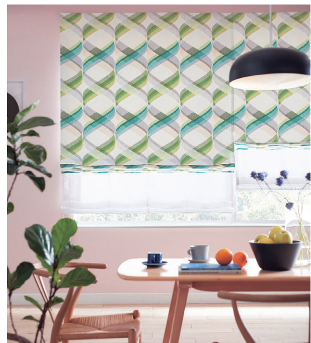
ブレンシェード・ダブルシェード仕様 前1395 後1606