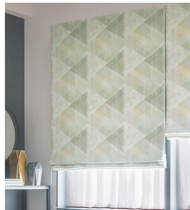
ブレンシェードI393 レースI595 / バイアスEF-499 (12)