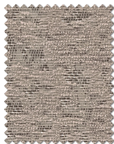
ML-1256 NEW P.7掲載 遮光(2級)