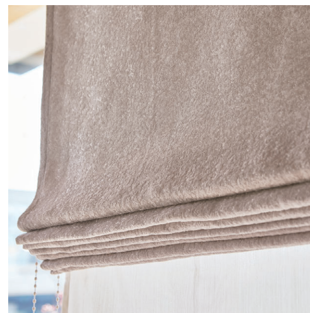
ブレースシェード・ダブルシェード仕様 前1255 後1641