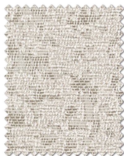
ML-1255 NEW P.7掲載