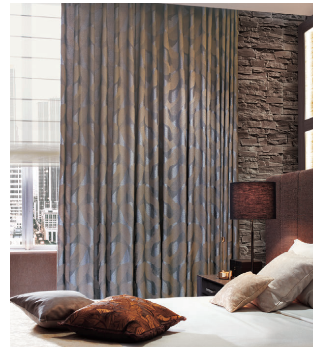
ドレープ1228 シャープシェード1591 クッション[手前から]1243(参考商品) 1242 1350(参考商品)

●ヒダの取り方により、写真とは柄の見え方が異なる場合があります。また、両開きの際に左右で柄が合わなくなる場合があります。 ●風通組織(二重織)のため、ヒダの谷間に若干シワがでる場合があります。生地特性として、ご了承ください。