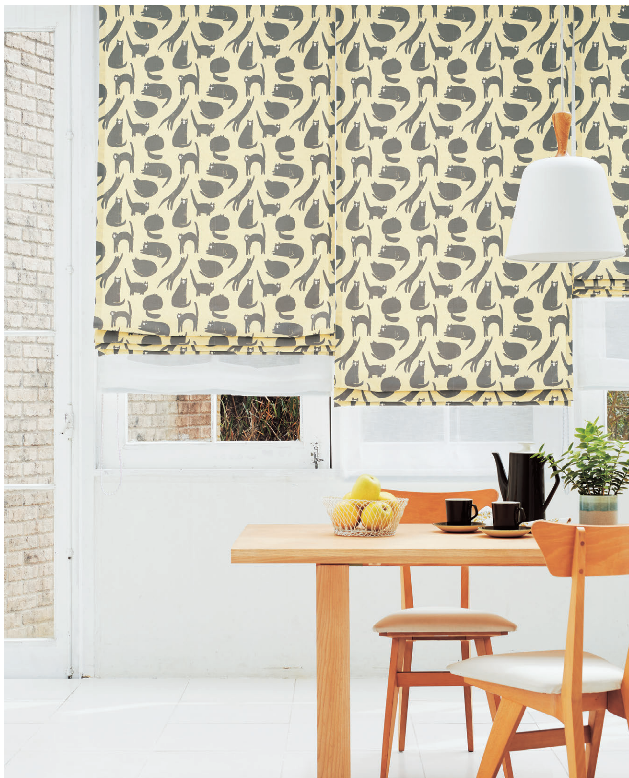
ブレースェード・ダブルシェード仕様 前1212 後1606