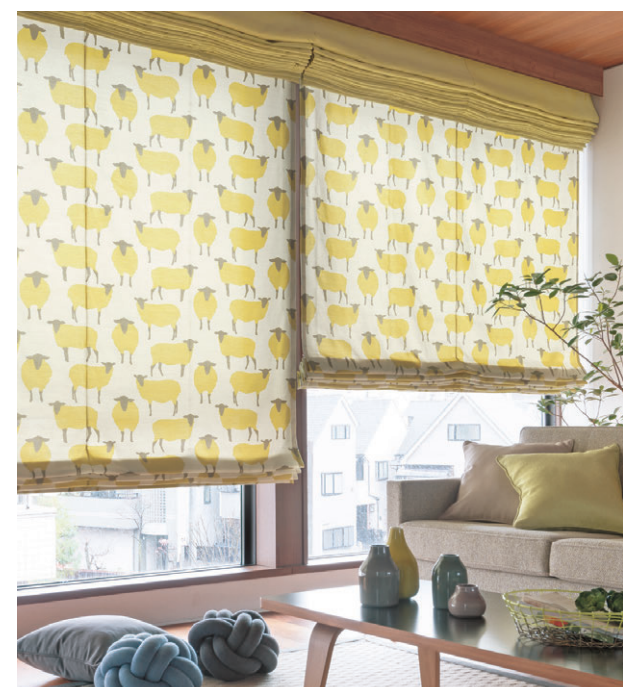
プレーンシェード・ダブルシェード仕様 前1278 後1209 クッション[左から] 1275 1336 1279