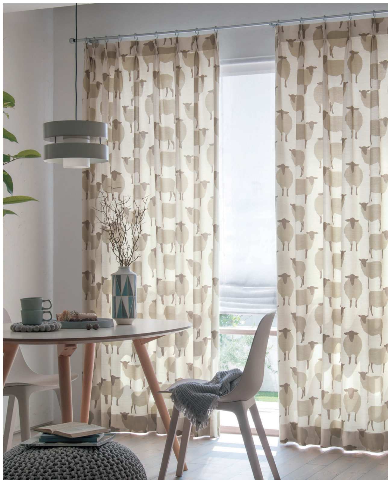
ドレープ1208 プレーンシェード1618