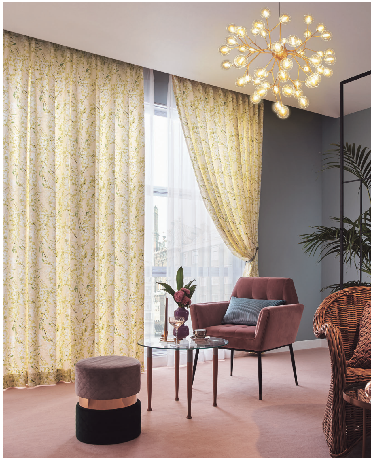
ドレープ1202 レース1629 タッセルEF-588 (05)